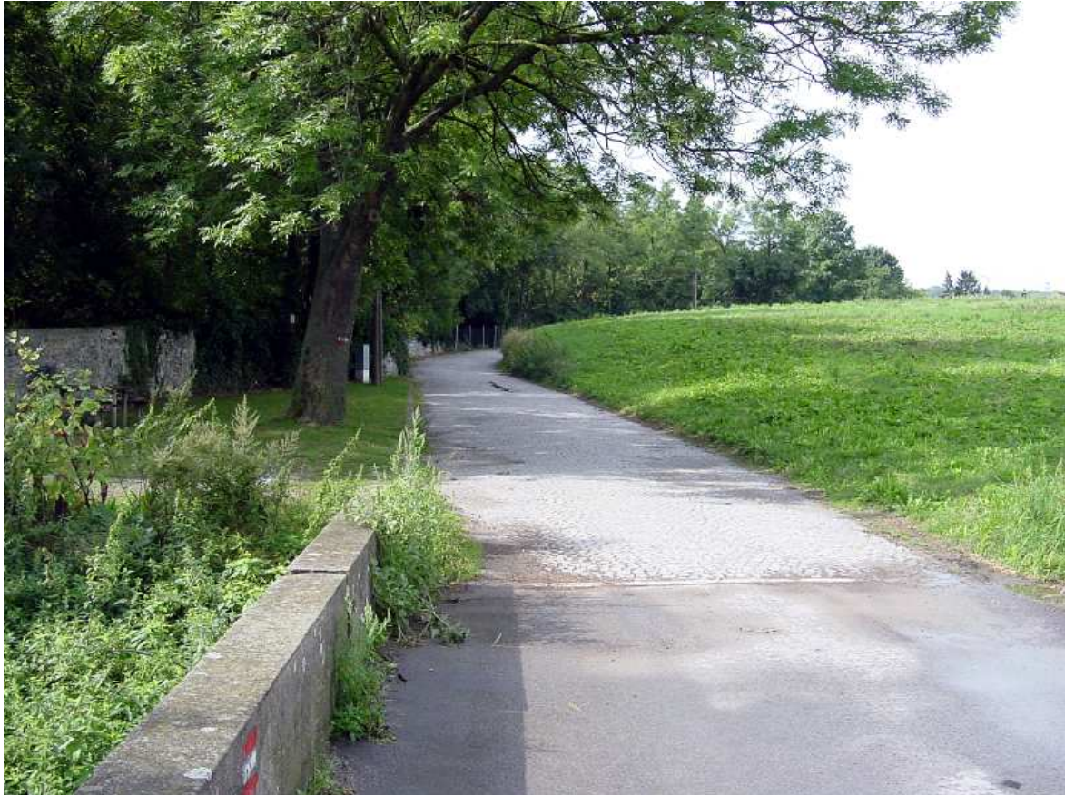
Abb.: Donauradweg ein paar Kilometer vor der slowakischen Grenze