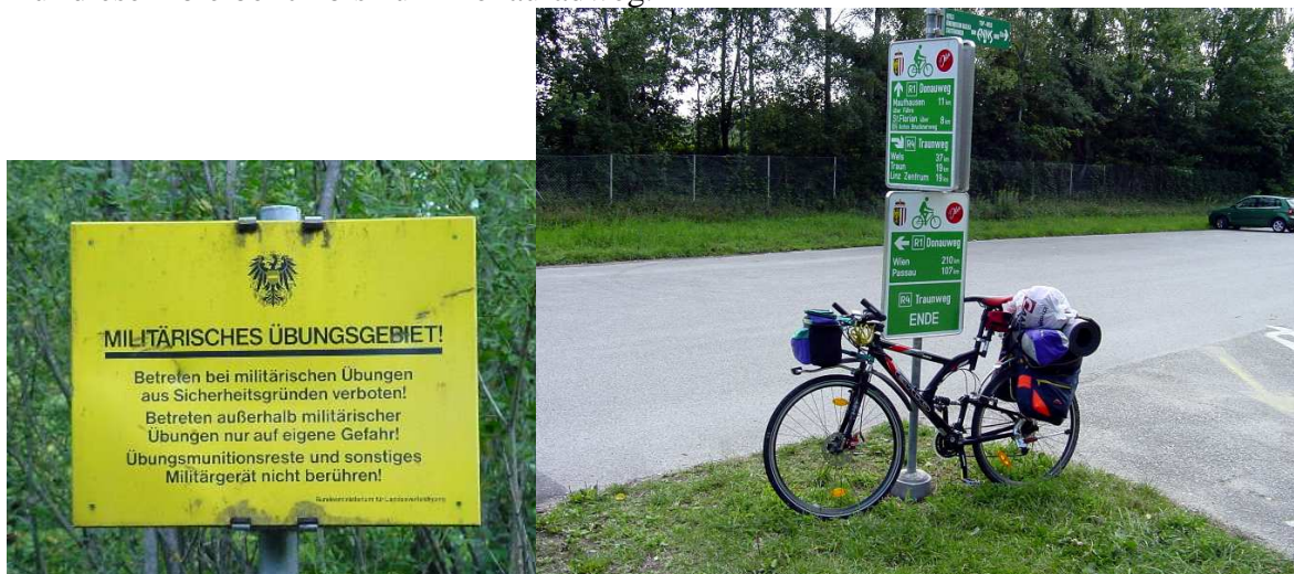
Abb.: links: Traunradweg bei Linz Ebelsberg

Von dort geht es Richtung Eberstallzell. Dort angekommen nehme ich den Almtalradweg bis Wels, wo er in den Traunradweg mündet. Auf diesem bleibe ich bis zum Donauradweg.