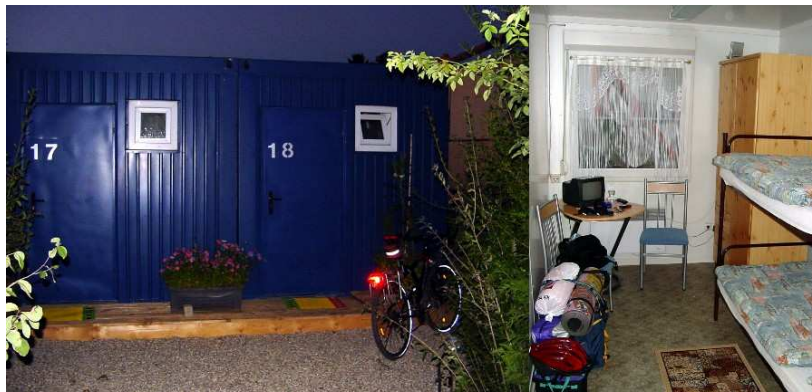
Abb.: In Nummer 18 übernachtete ich

Die Container waren von gepflegten Blumenbeeten und einem großen Fischteich im Garten umgeben.