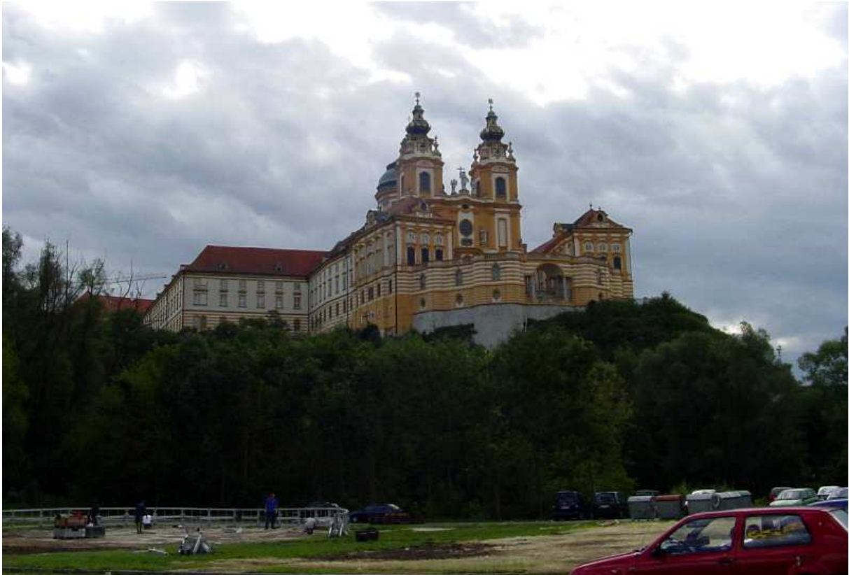
Abb.: Stift Melk