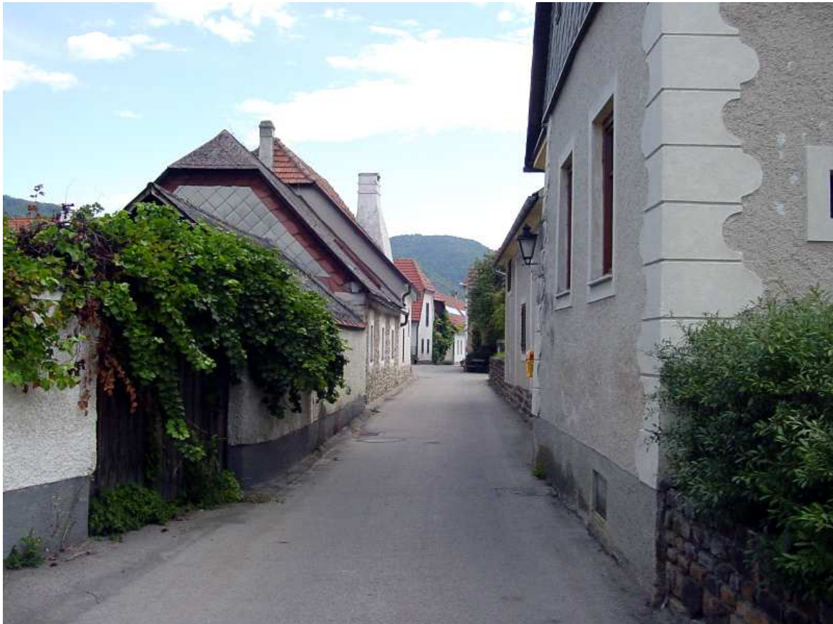
Abb.: Donauradweg in Niederösterreich