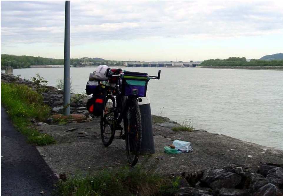
Abb.: In Melk wird das Wetter schöner

Morgens um sechs Uhr frühstücke ich nur wenig, um schnell vom Zeltplatz verschwinden zu können, bevor sehr viele Leute auf der Straße daneben vorbeifahren. Es regnet anfangs mäßig. In Melk frühstücke ich dann ausgiebig, als es zu regnen aufhört.