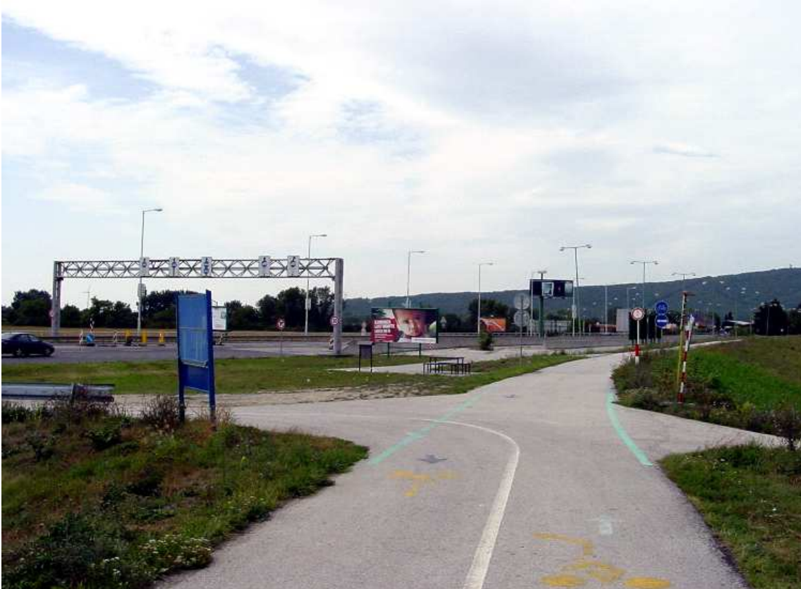
Abb.: Slowakischer Grenzübergang auf slowakischer Grenze