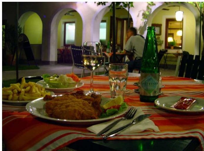
Abb.: zwei Stück Schnitzel am Teller, ... - sehr gut!!! ☺

Essen gehe ich im Gasthof Binder (wenn ich mich richtig erinnere), bei dem mich große Portionen erwarten. Ein sehr gutes Achtel Welschriesling gönne ich mir auch. In der Nacht gibt es Gewitter mit Regen, der bis am nächsten Tag (Vormittag).