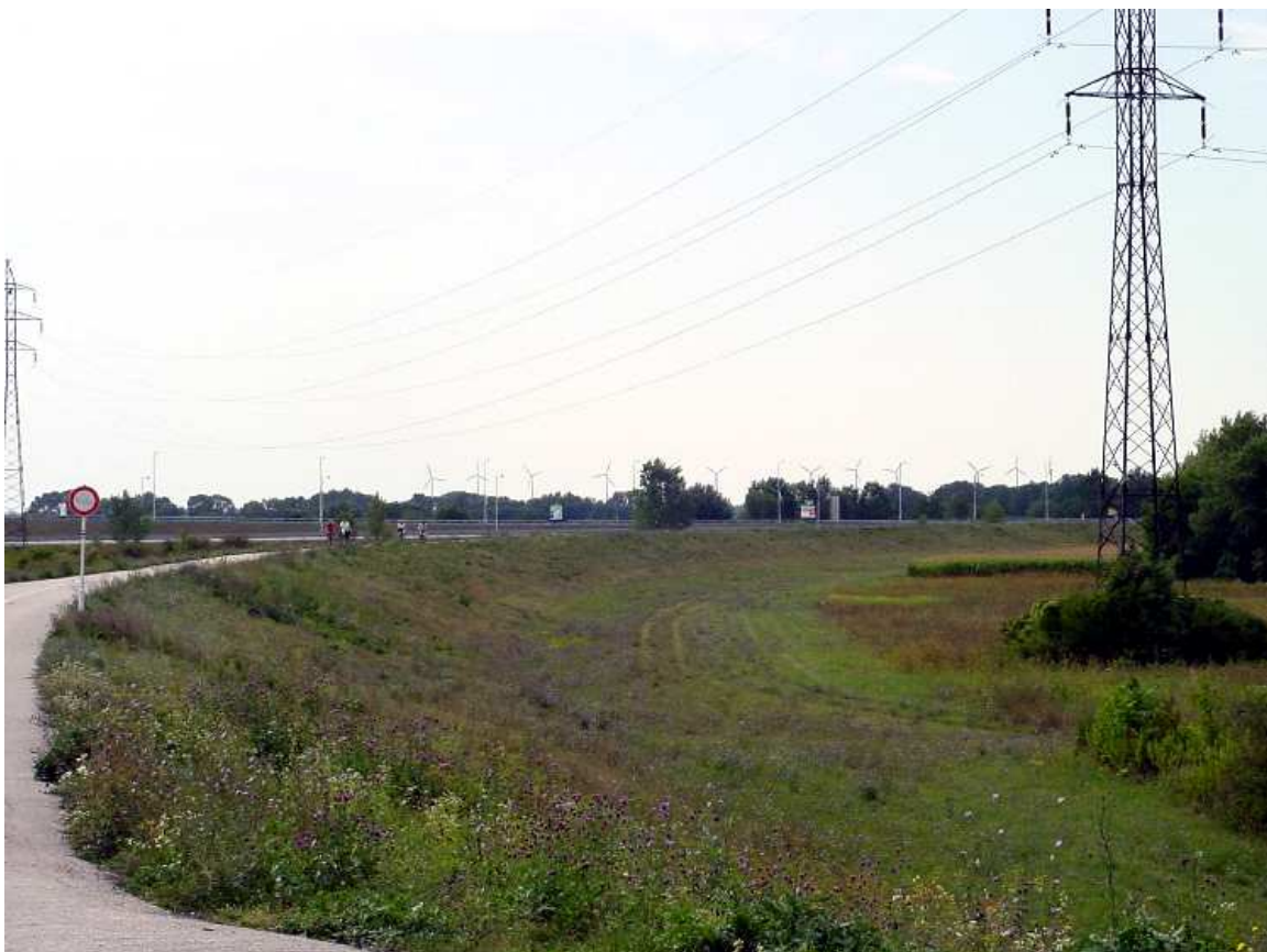
Abb.: Kurz nach dem Fotografieren an diesem Stück des slowakischen Donauradweges kurz vor der Grenze überholt mich ein mit Rundholz beladener Sattelschlepper mit guten 30 km/h (ziemlich enge Angelegenheit)